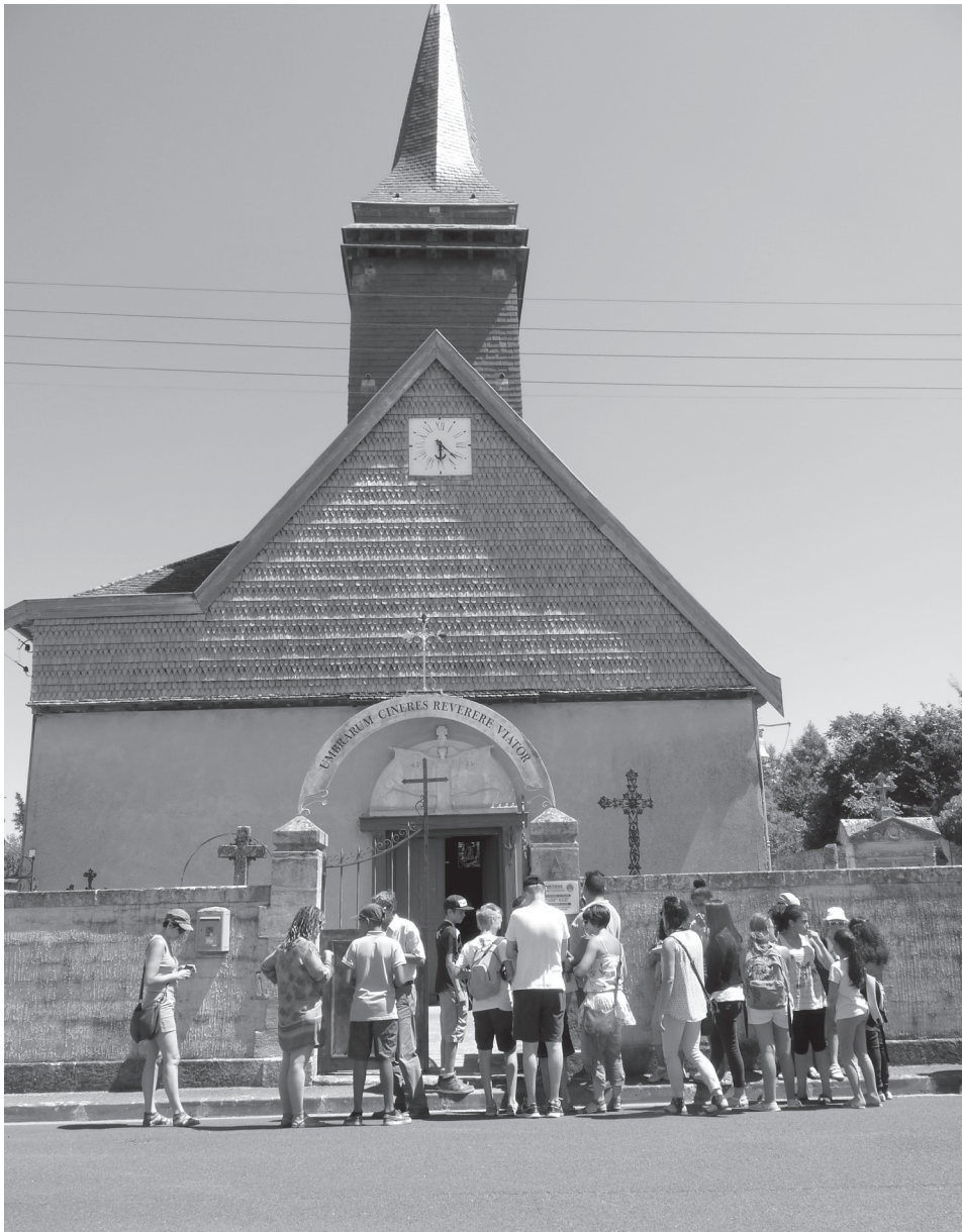
Les participants visitent le site patrimonial, la Chapelle Saint-Nicolas