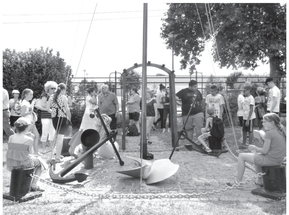
Les participants observent avec intérêt les ancres de bateaux