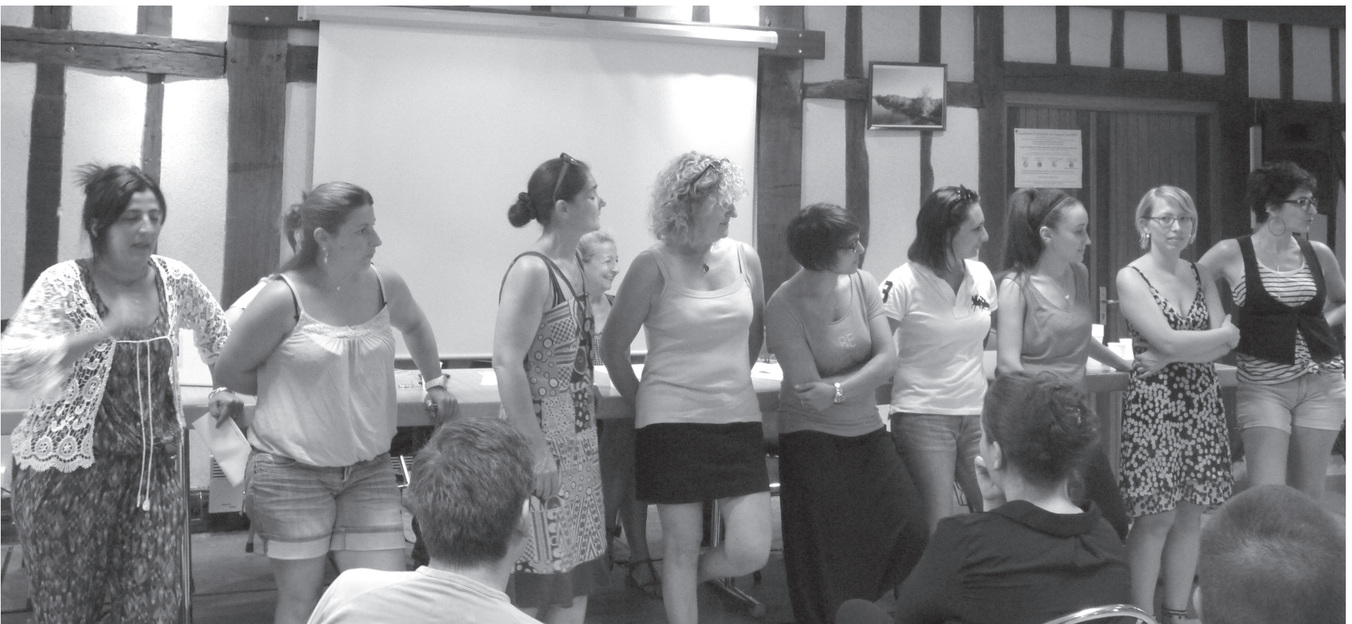
Les intervenants/accompagnateurs expriment leur satisfaction.