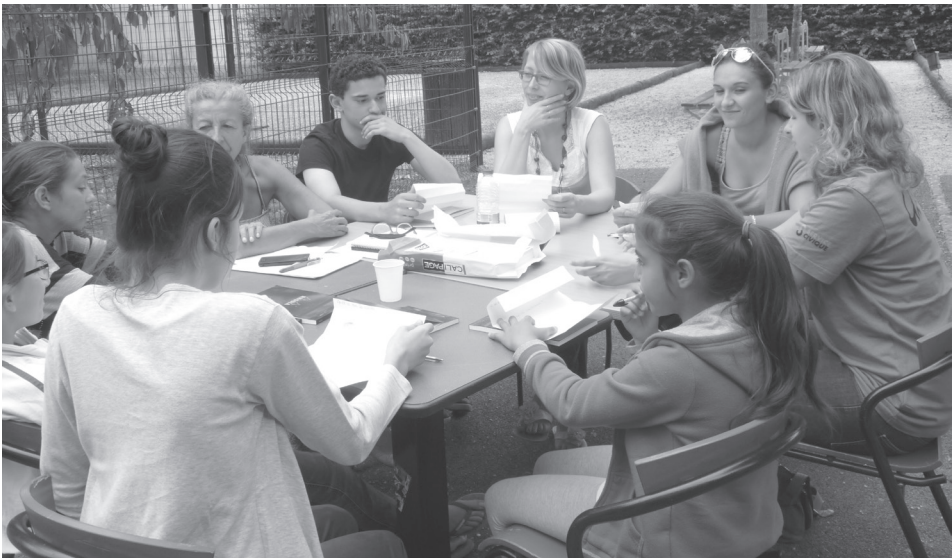
A l'Orange Bleue, les jeunes écrivent leur chanson

Statut : C’est en 1935 que cette Chapelle a été inscrite en tant que monument historique.