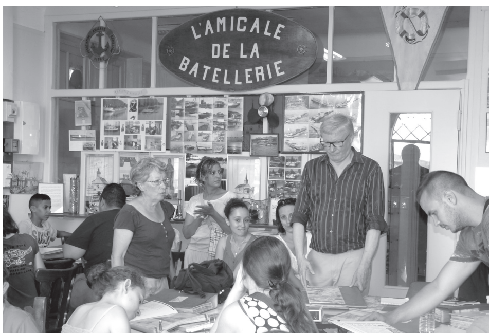
Les jeunes découvrent des objets utilisés par les bateliers