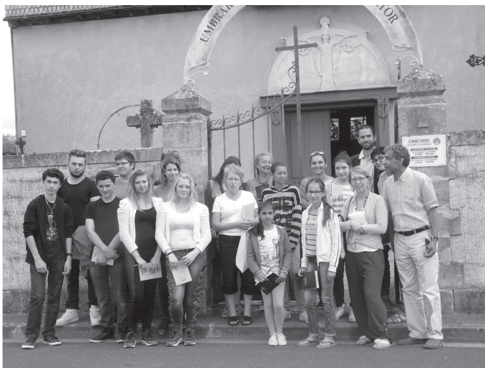
Souvenir des Portes du Temps