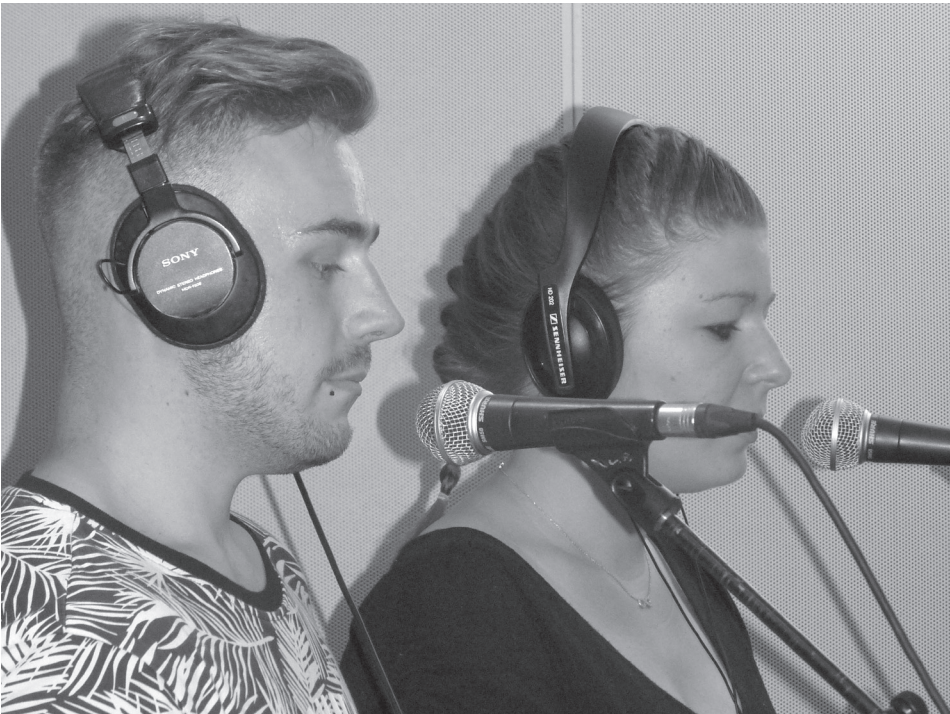
Les jeunes d'Unis-Cité participent aux Portes du Temps