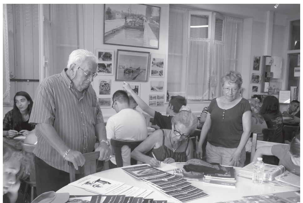
Les responsables du musée de La Bourse accueillent les jeunes