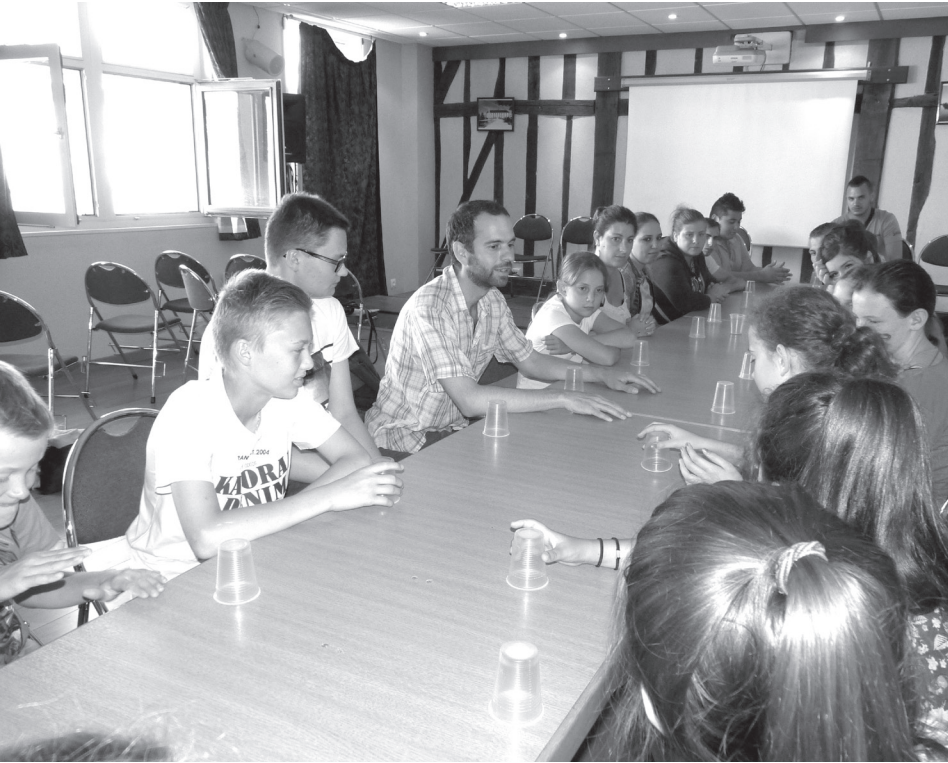
A la découverte de l'atelier de musique