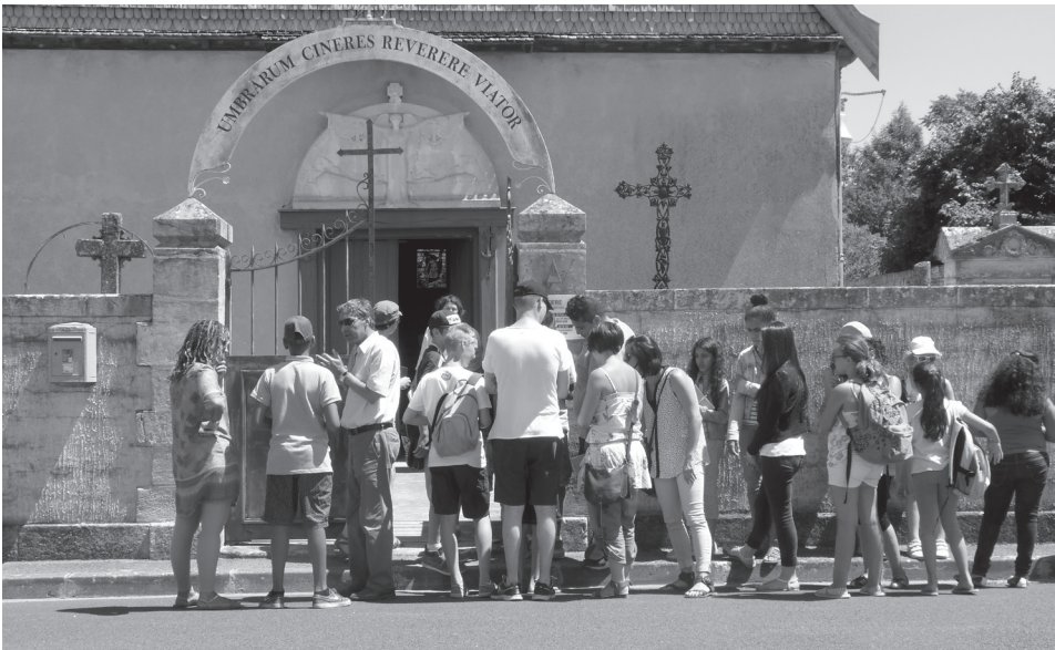
L'histoire du site patrimonial est liée à celle des bateliers