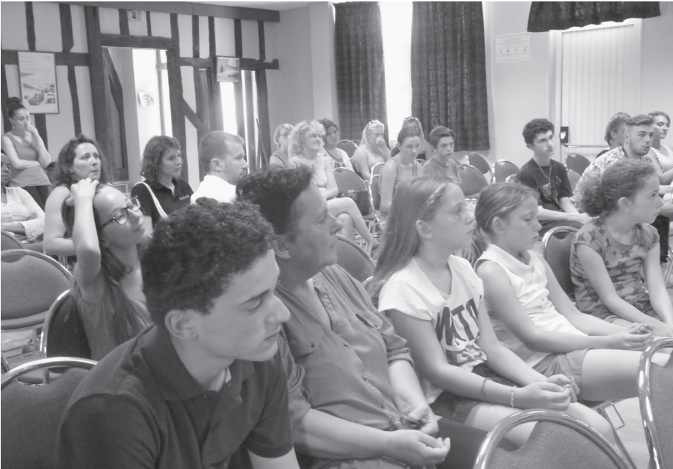
Les jeunes font le bilan et préparent l'aboutissement des Portes du Temps.

Ecrire tous ensemble en deux, trois jours les paroles d'une chanson, avec pour thème