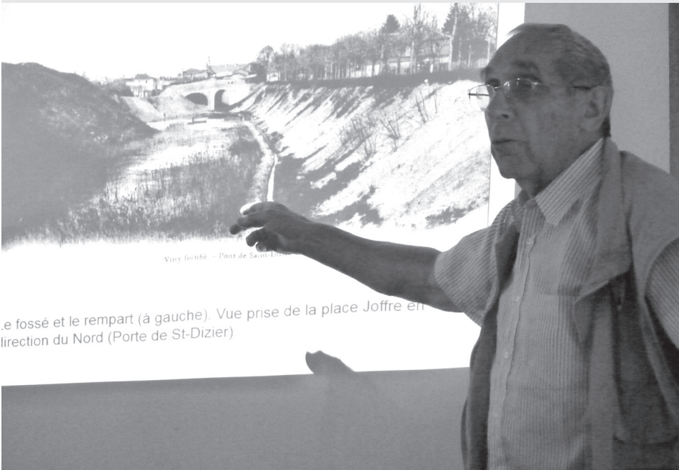
Vitry-le-François au fil du temps par Michel Picard

Association de l'Amicale de la Batellerie - Association Initiales Association Sciences et Arts - Centre Social et Culturel Ecole de la 2 e chance - Ecole Ouverte aux Parents Espace Paul Bert - Orange Bleue Programme de Réussite Educative - Service Lecture Publique - Unis-Cité.