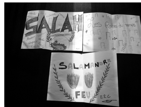
Quelques dessins des enfants