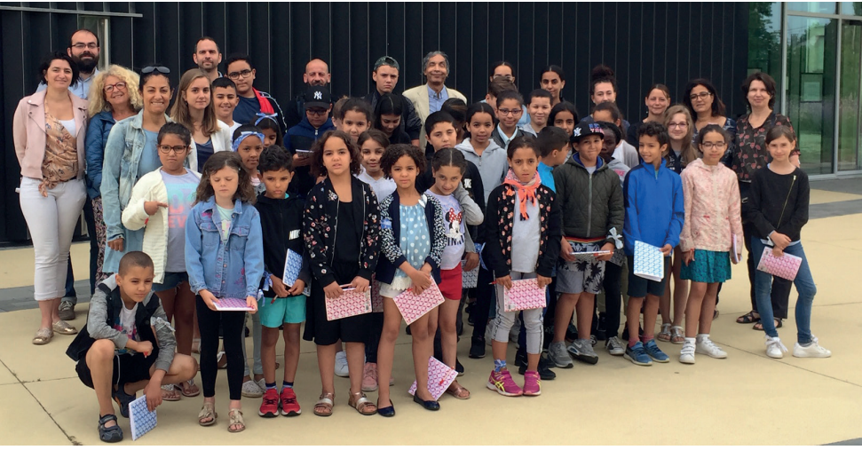
Jour 1 - Le groupe entier devant la médiathèque Albert Camus