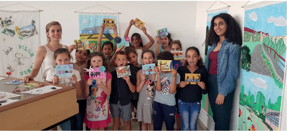
Les plus jeunes et leurs œuvres d'art