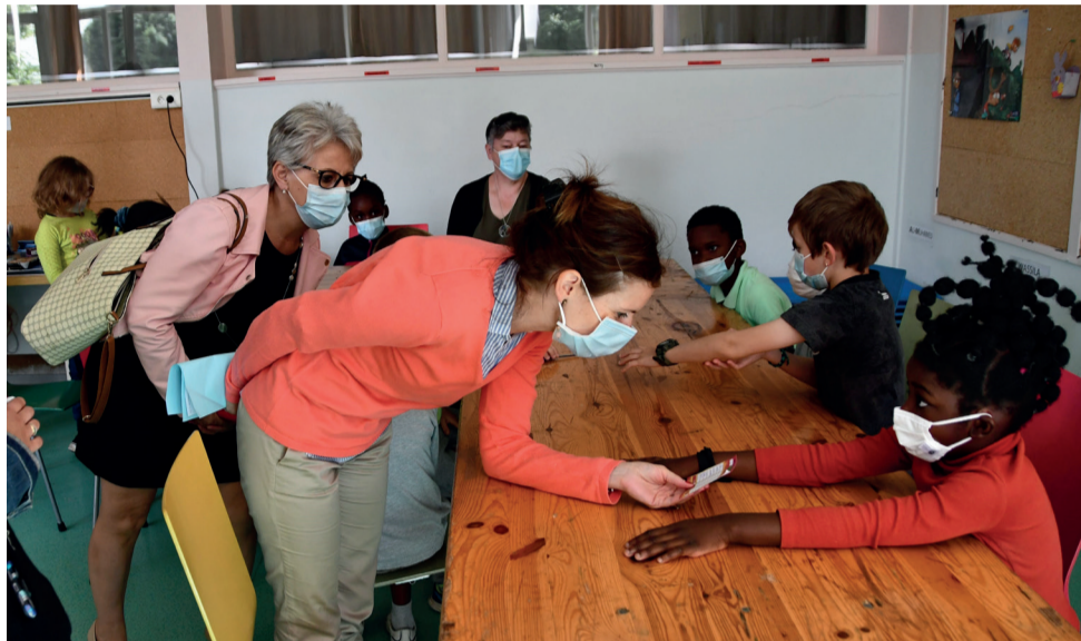
Mesdames la Sous-Préfète de Langres et la Déléguée du Préfet de la Haute-Marne visitent l'atelier consacré aux valeurs de la République et à la laïcité.

Sur les Chemins de l'écrit « Initiatives et expériences » N° 67 – Septembre 2021 Dépôt légal n° 328