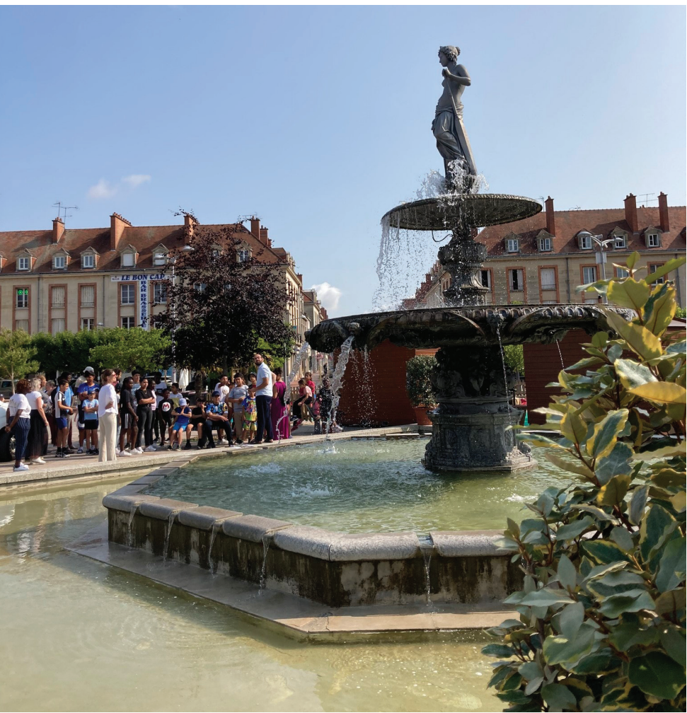
Simon Miniou, le cartographe de la ville, amène les jeunes à la rencontre d'une déesse.

La Fontaine de la Déesse Marne à Vitry-le-François