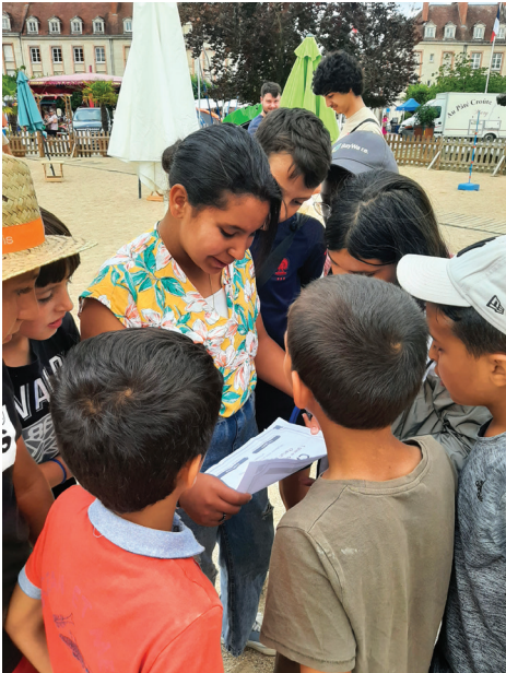
Les jeunes sont ravis de découvrir le trésor de la chasse au trésor. Ils gagnent une place à la piscine.