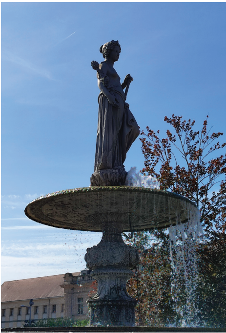
Statue déesse de la Marne.