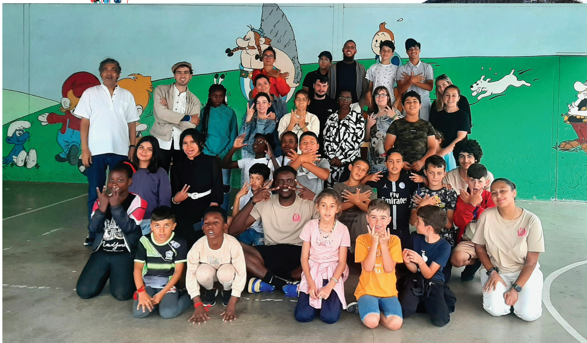
Les jeunes vitryats sont ravis de rencontrer une déesse.

SOMMAIRE • Éditorial par Edris Abdel Sayed – page 2 • S'abreuver de culture et de patrimoine... par Fériel Guebli – page 2 • Pour que la parole coule de source par Adrien Simonnot – page 2 • Échos de l'expression: les jeunes s'initient à la poésie Slam par Yanne Abbad – page 3 • Ils ont dit aussi... – page 4 • Les acteurs de « C'est mon Patrimoine ! » – page 4 • Les structures vitryates participantes – page 4 • Les partenaires qui ont accompagné et encouragé le projet – page 4