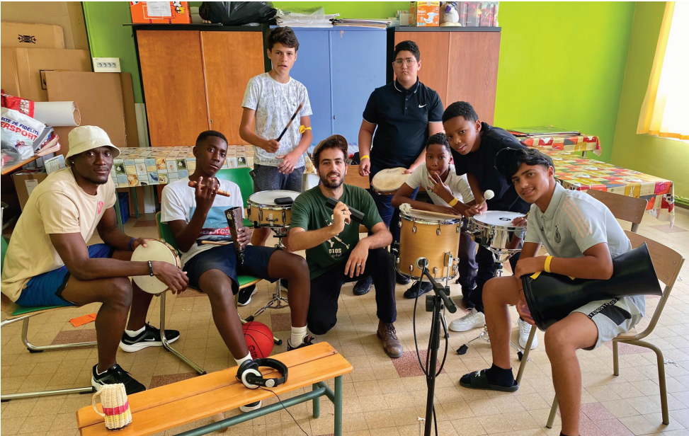
Les jeunes voyagent dans le monde universel de la musique.